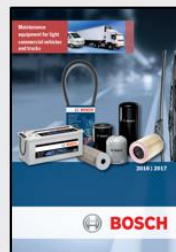
Održavanje Kamiona – Delovi Katalog: 1 987 720 030