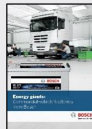
Brošura F 026 P03 705