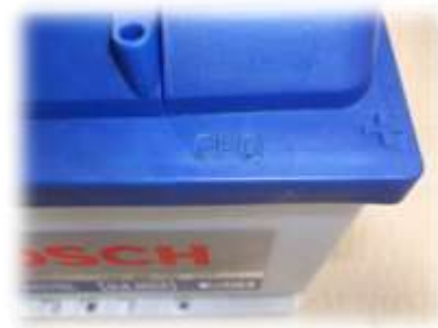
Primer novog FIFO koda

*Za određeno vreme može se desiti da postoje akumulatori u skladištima kupaca koji imaju stari ili novi kod zbog potrebnog vremena implementacije promene